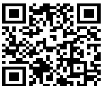
培训班报名二维码

2. 微信扫描“报名二维码”，进入报名页面，填写报名信息，信息不完整或不准确将无法授予学分，报名成功后扫码进入QQ交流群。